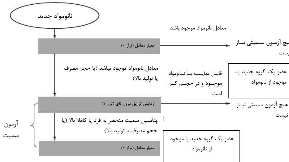
شکل ۳- معیار معادل مورد استفاده در چارچوب موثر ارزشیابی مخاطره موثر نانومواد